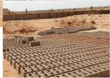
Die Ziegel werden vor Ort gebrannt

Fähigkeiten ausprobieren können. Einen Ort, an dem sie diskutieren, lachen, Sport machen können. An dem sie ermutigt werden, sich als aktive Bürger und Bürgerinnen in ihre Gesellschaft einzubringen. Mit den aktuellen politischen Entwicklungen im Land wird dieser Ort für junge Menschen noch wichtiger.