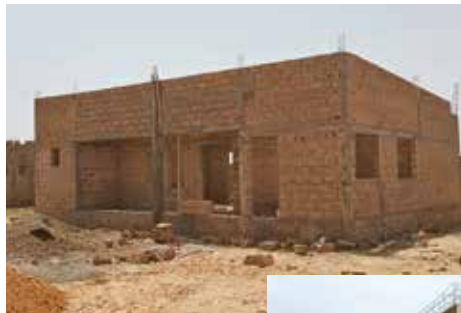
Seminar- und Bürogebäude noch ohne Dach und Fenster