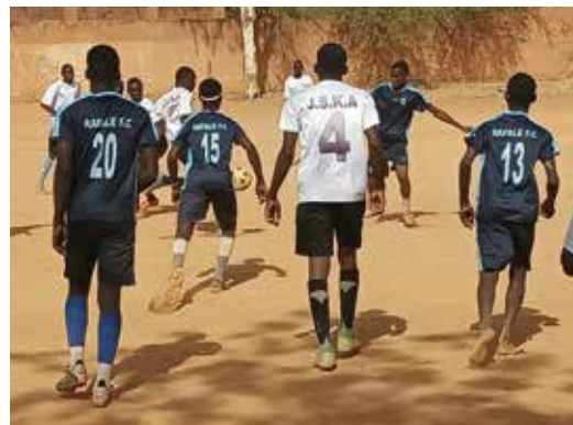
Nächster Bauabschnitt (Sportplatz) folgt bis Ende des Jahres