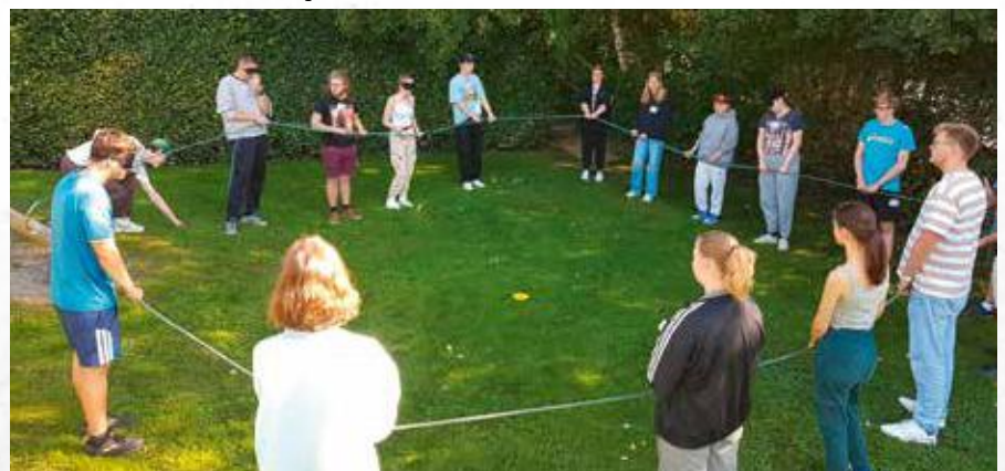
Gemeinsam wachsen, zum Beispiel bei FSJ-Seminaren

Referentin Freiwilligendienste in Deutschland im CVJM Deutschland