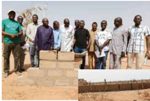
Feierlicher Baustart – gemeinsam werden die ersten Ziegel gesetzt