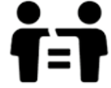
Eine gerechte Welt

YMCA Holyoke/USA durch den Sportlehrer William C. Morgan.