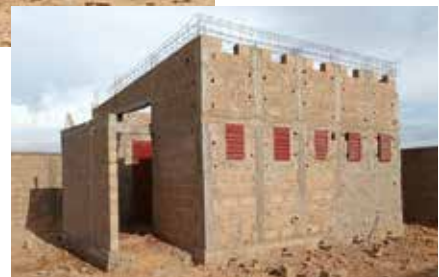
Gebäude für Sanitäranlagen steht