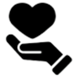
Wohlbefinden der Community